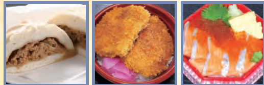
もち豚ぶたまん 新潟タレかつ丼 佐渡銀鮭親子丼